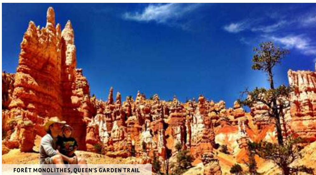
FORÊT MONOLITHES, QUEEN'S GARDEN TRAIL