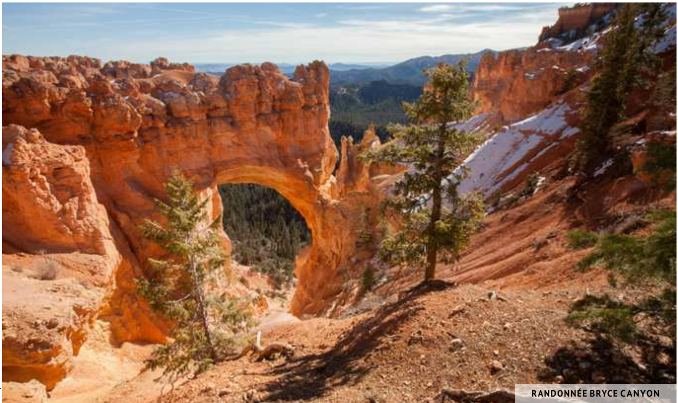
RANDONNÉE BRYCE CANYON

* Attention toutefois si vous voyagez avec un camping-car de plus de 19 pieds (6 mètres), vous serez restreints dans vos déplacements pendant les heures d'opération de la navette et serez donc dans l'obligation de garer votre véhicule dans l'aire de stationnement supplémentaire juste en face du Visitor Center et d'utiliser la navette pour vous déplacer. Vérifiez auprès du personnel du parc avant de vous aventurer sur les routes inutilement avec votre camping-car !