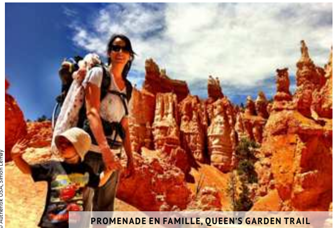
PROMENADE EN FAMILLE, QUEEN'S GARDEN TRAIL

Voici le point le plus au sud de tout l'amphithéâtre et aussi le plus impressionnant, car il est situé à 2 528 mètres de hauteur ! Quoi de mieux qu'un coucher de soleil sur Bryce Point ★★★ pour terminer votre journée en beauté ?