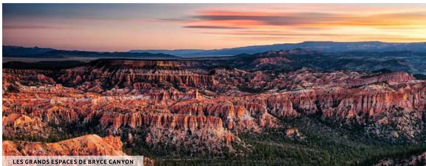
LES GRANDS ESPACES DE BRYCE CANYON