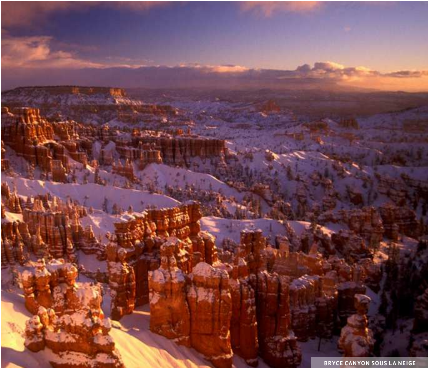
BRYCE CANYON SOUS LA NEIGE