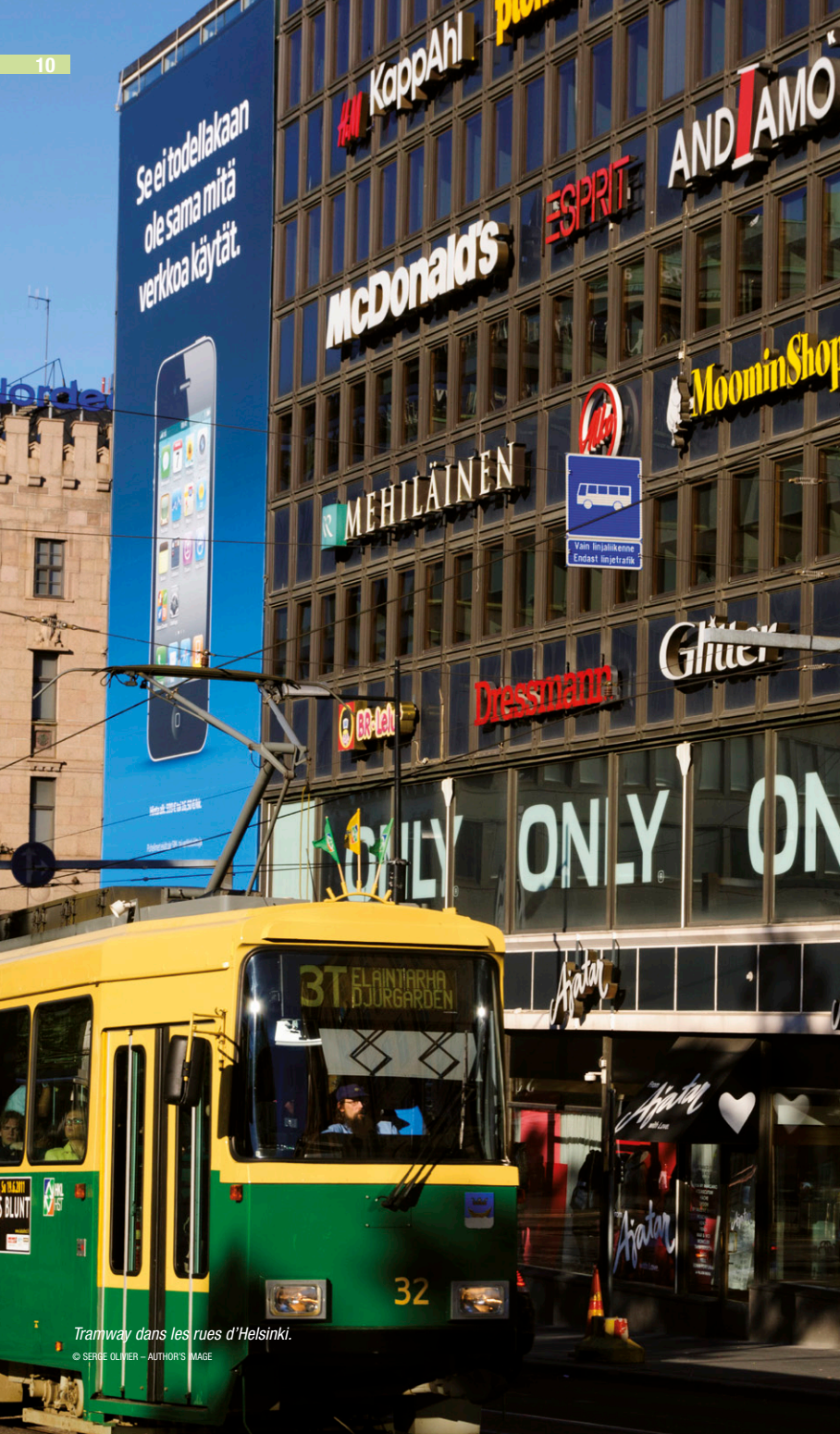
Tramway dans les rues d'Helsinki.