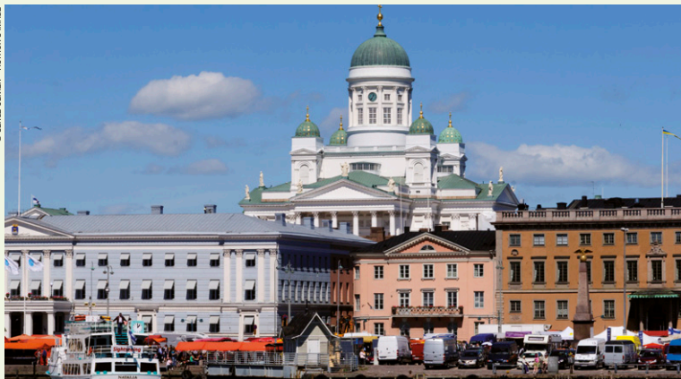
Cruise Circle line.