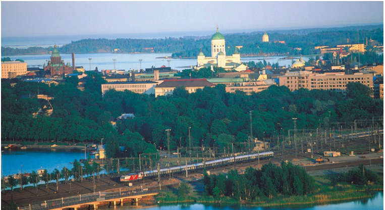
Vue panoramique d'Helsinki.

75, rue Richelieu (2 e ) Paris ☎ 01 49 26 93 33 www.mer-et-voyages.com info@mer-et-voyages.com