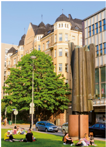
Jardin botanique de l'université d'Helsinki.

Votre dose d'animaux absorbée, vous pourriez envisager de retourner vers le centre-ville pour un dîner d'observation des humains. Prendre un repas russe au Saslik, idéal pour les carnivores curieux de tester de l'ours ! Fort de ce bon repas, une petite danse au Pavi dans la banlieue de Vantaa s'impose. Après avoir patienté 40 minutes dans un bus pris à Rautatienitori, vous aurez enfin l'occasion de faire l'expérience d'un vrai iskelmä et de pratiquer votre tango !