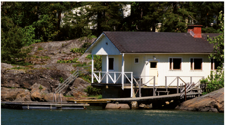
Visite des îles par le canal, à Helsinki.

► Suomenlinna. Depuis Kauppatori, sur le port, prenez le ferry qui vous conduira à l'île-forteresse de Suomenlinna. Inscrite au patrimoine mondial de l'UNESCO, elle est bâtie sur plusieurs îles dans la rade d'Helsinki. Ses tunnels ressemblent à des caves et ses meurtrières à canons sont d'une rare beauté ! N'oubliez pas votre appareil photo et offrez-vous une promenade sur les remparts battus par le vent du large ! On trouve, dans les parages, galeries d'arts, ateliers et musées, une église-phare, un sous-marin transformé en musée, des cafés et restaurants. Située à mi-chemin entre l'ouest et l'est, Helsinki a depuis toujours été prise en étau entre la Suède et la Russie. La « forteresse de Finlande » est édiflée en 1748 par l'amiral suédois Augustin Ehrensvärd sur un groupe d'îles et d'îlots dans la rade d'Helsinki. D'abord nommée « Sveaborg » (forteresse de Suède, la Finlande appartenant à l'époque au royaume suédois), cette place forte visait à défendre la ville contre l'expansionnisme russe. Longtemps considérée comme inviolable, elle est livrée aux troupes du tsar sans combattre. La Finlande est alors intégrée à l'Empire russe. Pendant la guerre de Crimée (1854), elle participe activement et efficacement à la défense de la Russie contre les forces navales françaises et britanniques. En 1918, après l'indépendance de la Finlande, elle prend le nom finnois de Suomenlinna.