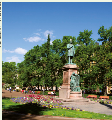
Statue de Eino Leino, Parc de l'Esplanade, Helsinki.